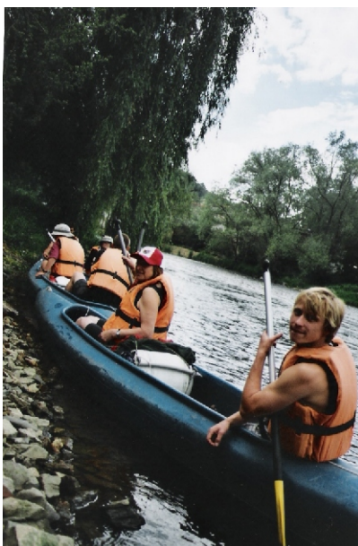
Víkendový výjezd - Vltava