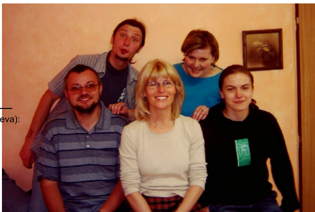
Tým Kontaktního Centra (zleva):

Posláním Kontaktního centra je prostřednictvím odborných služeb snižovat zdravotní a sociální rizika a důsledky užívání drog pro jednotlivce, rodiny a širokou veřejnost na Plzeňsku.