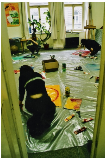
Práce v arteterapeutické dílně